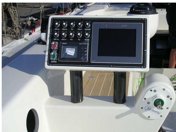
Dettaglio della scatola di governo BG12QM installata sulla colonnina inclinata