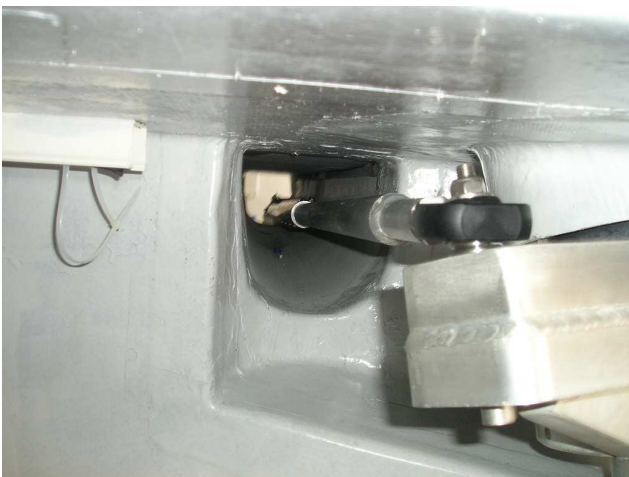
L'asta di collegamento si trova all'interno di un apposito vano