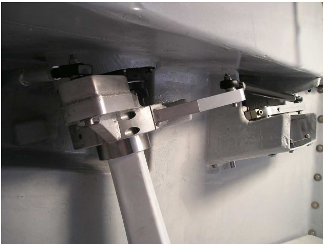
Il doppio braccio solidale all'asse timone è comandato da un lato dalla scatola di riduzione