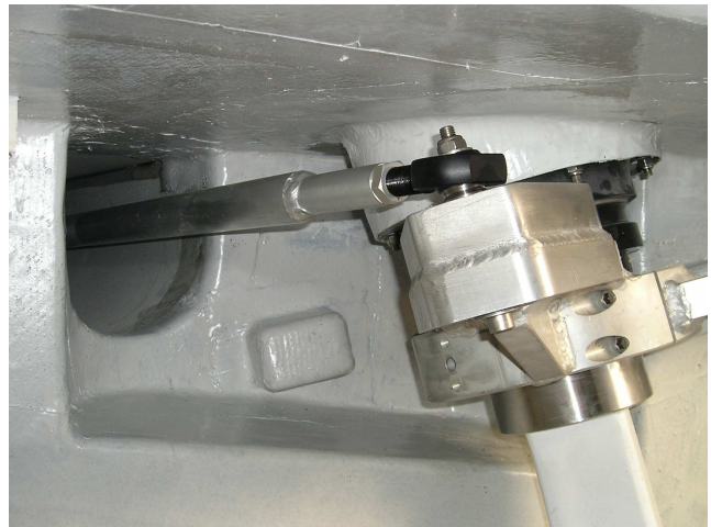
L'altro lato del braccio trascina l'asta di collegamento con l'altro timone