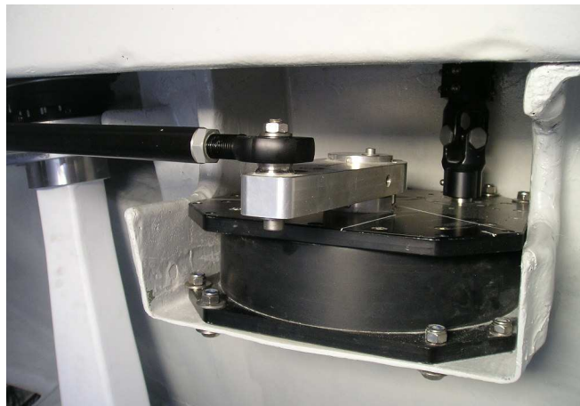
Una delle due scatole di riduzione RG10-100 con relativo giunto universale e albero di trasmissione proveniente dalla scatola di governo